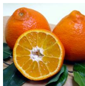
Sugar Belle® (LB8 9 c.v.)