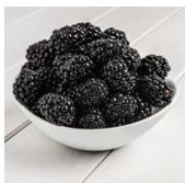
Mary Carmen® (APF 122 c.v.)