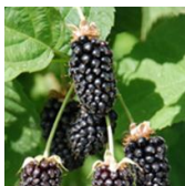
Columbia Sunrise c.v.