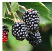
Prime-Ark® 45 (APF 45 c.v.)