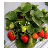
Sweet Charlie (FL 85 4925 c.v.)