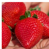
Brilliance™ (FL 13 26 134 c.v.)