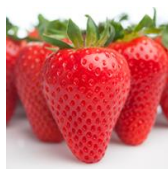
Winterstar® (FL 05 107 c.v.)