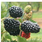
Traveler™ (APF 190T c.v.)