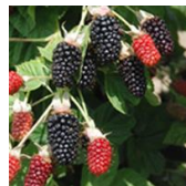
Hall's Beauty c.v.