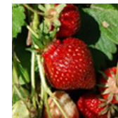
Marys Peak c.v.