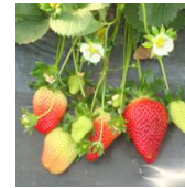
Festival™ (FL 95 41 c.v.)