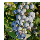
Mini Blues c.v.