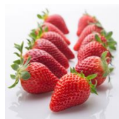
Sensation™ (FL 09 127 c.v.)