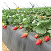
Elyana™ (FL 00 51 c.v.)