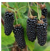
Columbia Giant c.v.